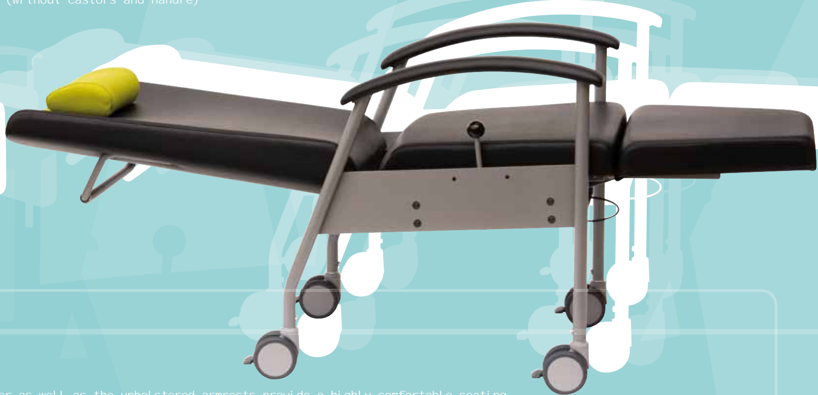
sita 4490200 in Liegeposition horizontal position

Large cushions, the integrated movable bolster as well as the upholstered armrests provide a highly comfortable seating of the patient in every chair position – in addition the side parts avoid the patient falling off the chair. Mobile sita chairs have a sturdy frame of coated steel with four double castors (ø 100 mm) that can individually be locked. With the sita accessories the chair can be equipped according to one's requirements.