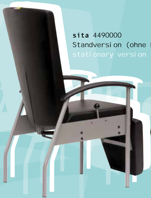
sita 4490000 Standversion (ohne Rollen und Schubbügel) stationary version (without castors and handle)

Groß dimensionierte Polsterflächen, die verschiebbare, integrierte Nackenrolle und die gepolsterten Armauflagen sorgen für hohen Komfort in jeder Position der Liege – die Seitenteile bieten gleichzeitig Schutz gegen Herausfallen. Das robuste Untergestell aus beschichtetem Stahl verfügt in der fahrbaren Version über vier einzelgebremste, total feststellbare Doppelrollen (ø 100 mm). Mit dem sita Zubehörprogramm (Rückseite) kann die Liege praxisnah ausgerüstet werden.